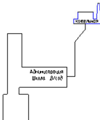
Рис. 2.3.1. Схема тепловой сети котельной Школьная с.Белоглазово

Описание тепловых сетей источников теплоснабжения МО Белоглазовский сельсовет представлено в табл. 2.3.1-2.3.2