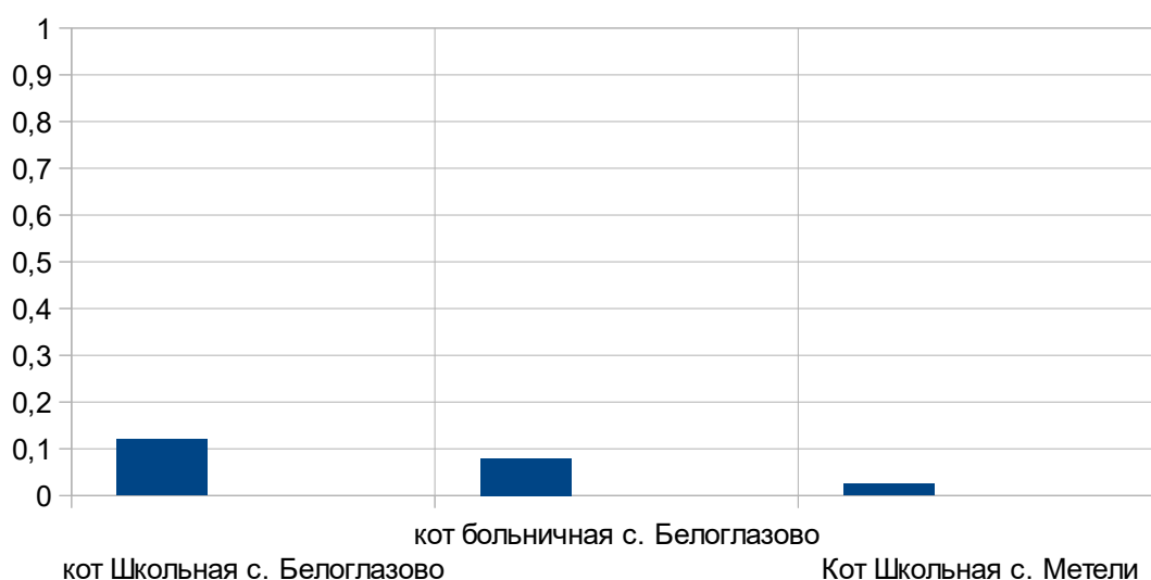
Рис. 2.5.1. Распределение тепловых нагрузок по котельным МО Белоглазовский сельсовет